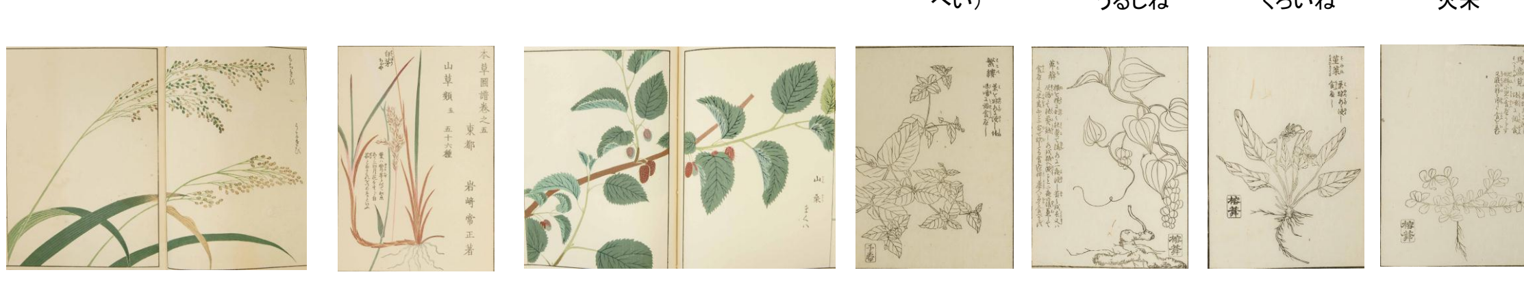
ひんげんまめ けふな みづな 菠薐(はれう) はうれんそう 薺(せい)なづな いね 糯米(だべい) 粳米(かうべい) うるしね むらさきいね くらいね おかほ 旱稲 火米