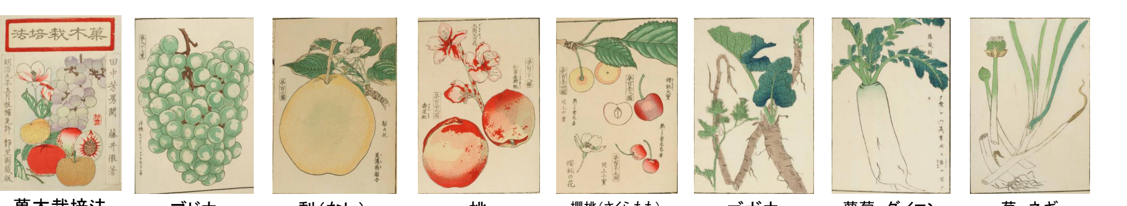
菓木栽培法 ブドウ 梨(なし) 桃 櫻桃(さくらもも) さくらんぼ ゴボウ 蘿蔔 ダイコン 葱 ネギ