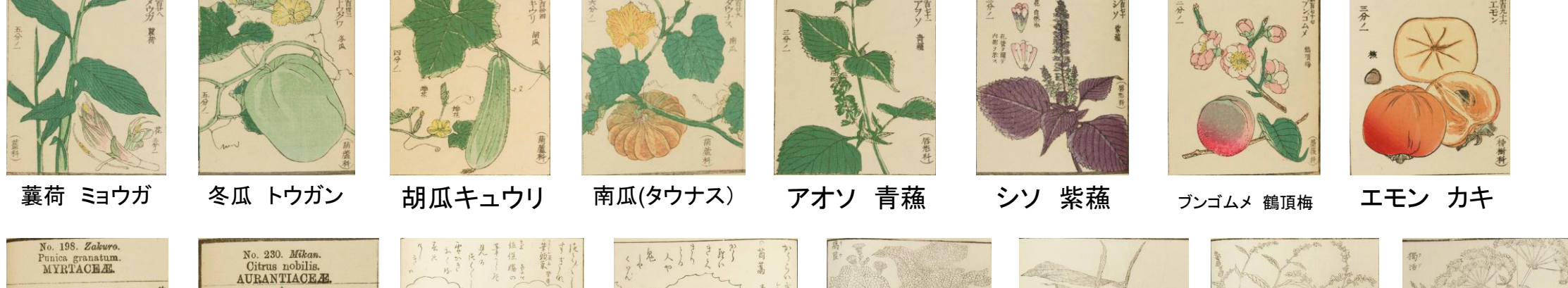
蕪荷 ミョウガ 冬瓜 トウガン 胡瓜キュウリ 南瓜(タウナス) アオソ 青蕪 シソ 紫蕪 ブンゴム 鶴頂梅 エモン カキ