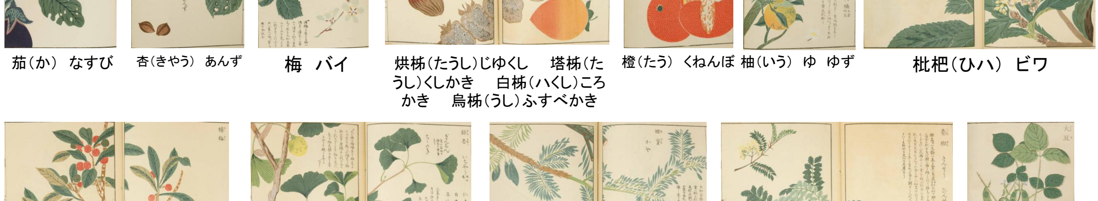
茄(か) なすび 杏(きやう) あんず 梅 バイ 烘柿(たうし)じゆくし 塔柿(たうし)くしかき 白柿(ハクし)ころかき 烏柿(うし)ふすべかき 橙(たう)くねんぼ 柚(いう)ゆ 枇杷(ひハ) ピワ