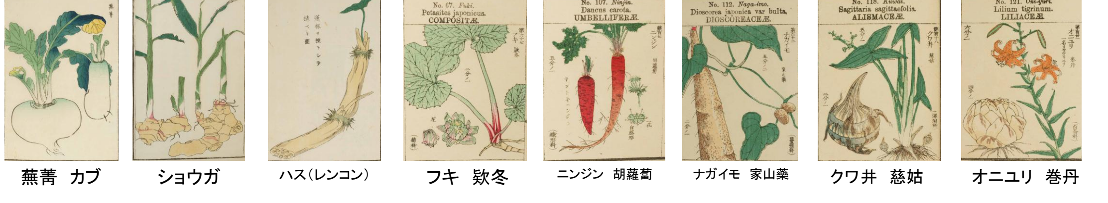
蕪菁 カブ ショウガ ハス(レンコン) フキ 欵冬 ニンジン 胡蘿蔔 ナガイモ 家山藥 クワ井 慈姑 オニユリ 卷丹