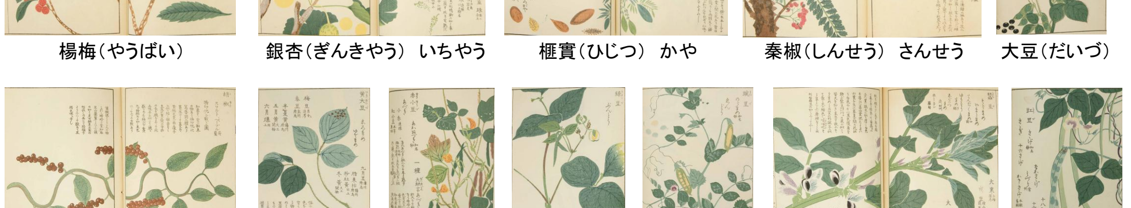
楊梅(やうばい) 銀杏(ぎんきやう) いちやう 榲桲(ひじつ) かや 秦椒(しんせう) さんせう 大豆(だいづ)