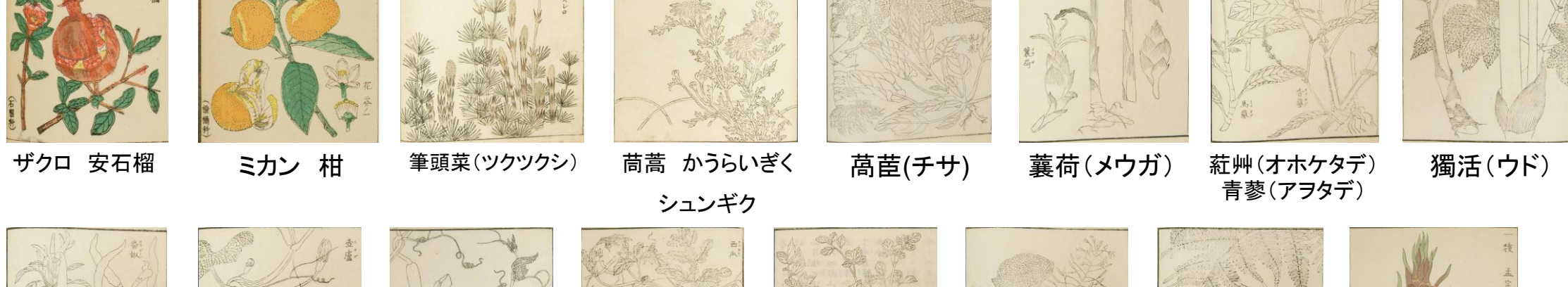
ザクロ 安石榴 ミカン 柑 筆頭菜(ツクツクシ) 萵蒿 かうらいぎく シュンギク 高苣(チサ) 蕪荷(メウガ) 紅艸(オホケタデ) 青蓼(アヲタデ) 獨活(ウド)