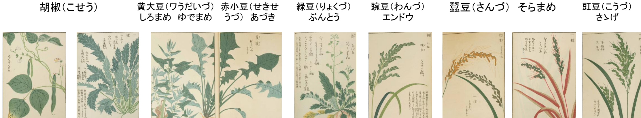
胡椒(こせう) 黄大豆(ワうだいづ) しろまめ ゆでまめ 赤小豆(せきせう) ふう 緑豆(りよくづ) ぶんとう 豌豆(わんづ) エンドウ 蠶豆(さんづ) そらまめ 豇豆(こうづ) さいげ