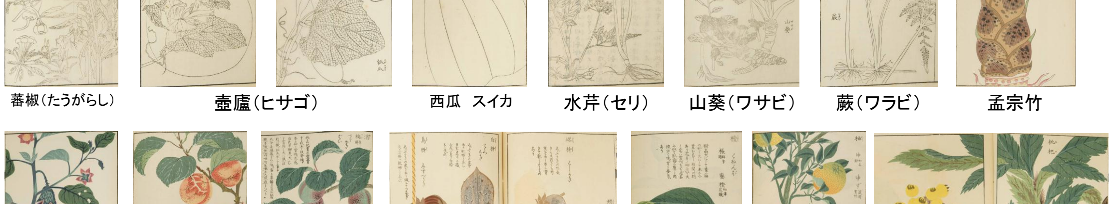
蕪荷(たうがらし) 壺廬(ヒサゴ) 西瓜 スイカ 水芹(セリ) 山葵(ワサビ) 蕪(ワラビ) 孟宗竹