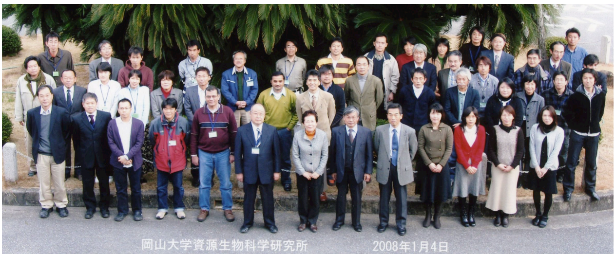
岡山大学資源生物科学研究所 2008年1月4日