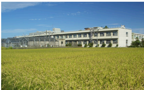
あきたこまちは今後も豊作でした(2008年9月)