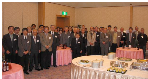
懇親会参加の皆様

且原先生には、研究所創立90周年記念事業の一つ「屋上緑化プロジェクト」をご紹介します。プロジェクトの概要は以下をご参照下さい。