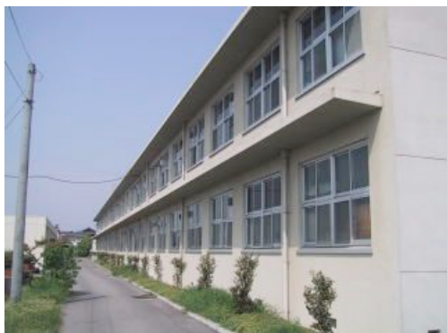
研究棟 1 号館