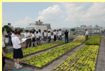
平成19年度ひらめき☆ときめきサイエンスの一角(屋上緑化の見学会)

平成19年度は8/25にひらめき☆ときめきサイエンス～ようこそ岡山大学資源生物科学研究所へ～KAKENHI、平成20年度は8/1にサイエンスブートキャンプ in 倉敷を開催しました。